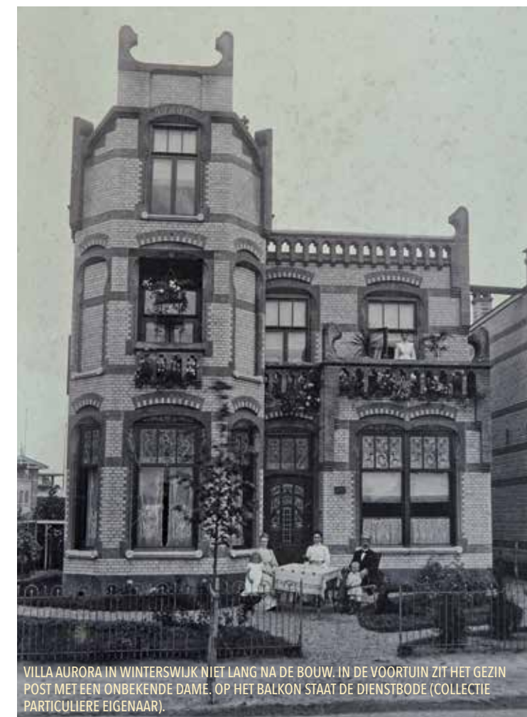
VILLA AURORA IN WINTERSWIJK NIET LANG NA DE BOUW. IN DE VOORTUIN ZIT HET GEZIN POST MET EEN ONBEKENDE DAME. OP HET BALKON STAAT DE DIENSTBODE.

heeft een traditionele plattegrond met een centrale gang. Links zijn de vertrekken gericht op representatie, rechts de daagse eetkamer en daarachter de keuken.