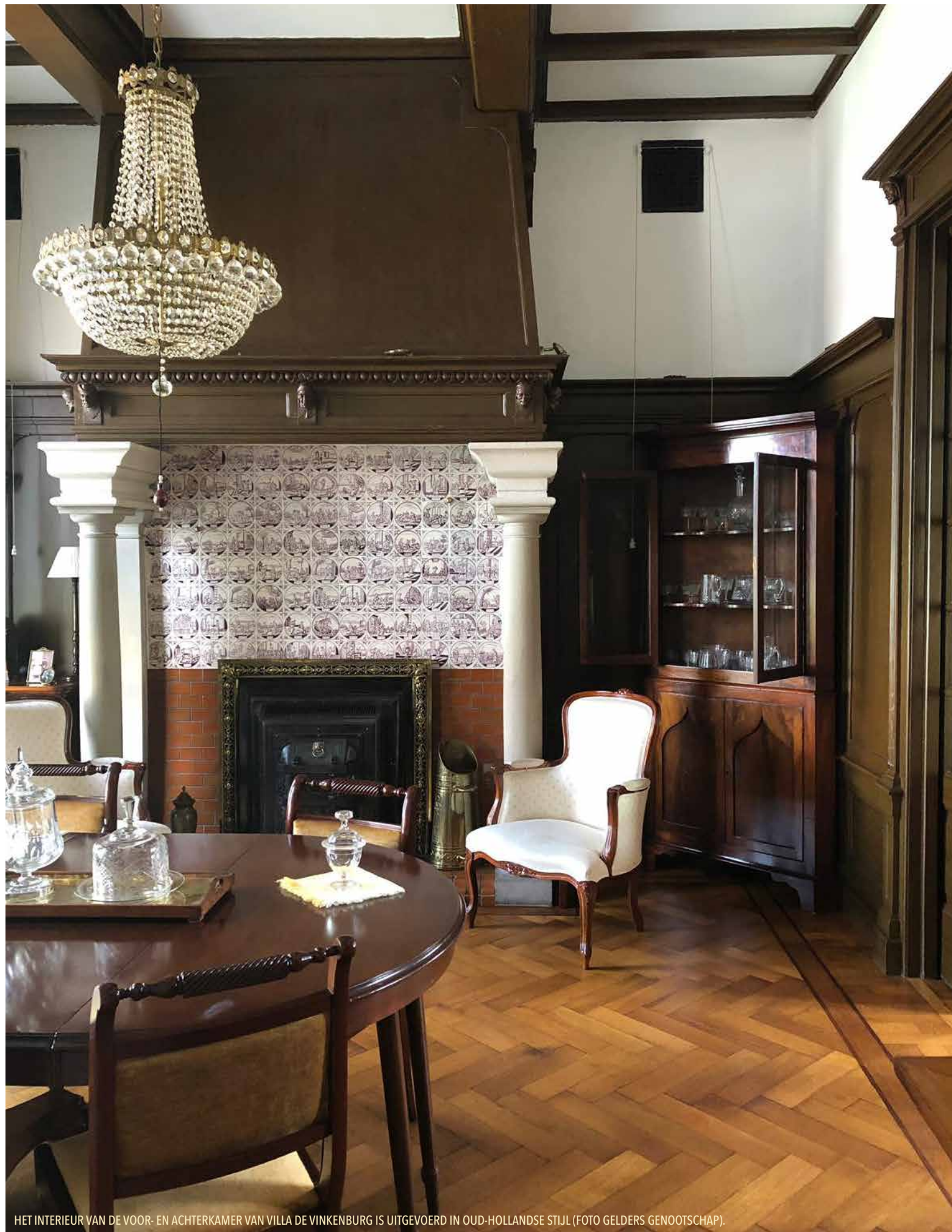
HET INTERIEUR VAN DE VOOR- EN ACHTERKAMER VAN VILLA DE VINKENBURG IS UITGEVOERD IN OUD-HOLLANDSE STIJL.