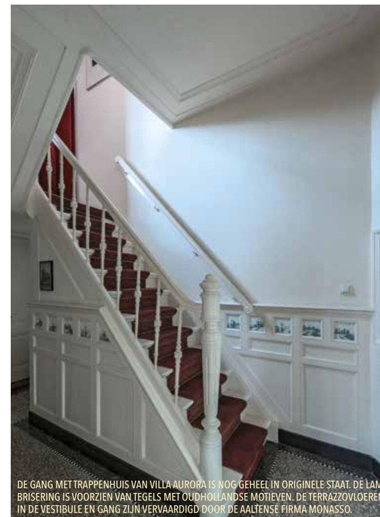
DE GANG MET TRAPPENHUIS VAN VILLA AURORA IS NOG GEHEEL IN ORIGINELE STAAT. DE LAMBRISERING IS VOORZIEN VAN TEGELS MET OUDHOLLANDSE MOTIEVEN. DE TERRAZZOVLOEREN IN DE VESTIBULE EN GANG ZIJN VERVAARDIGD DOOR DE AALTENSE FIRMA MONASSO.