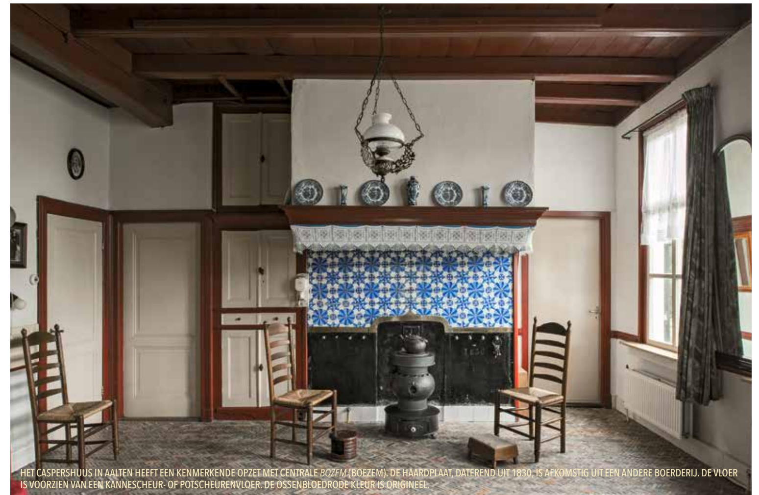
HET CASPERSHUIS IN AALTEN HEEFT EEN KENMERKENDE OPZET MET CENTRALE BOEZEM (BOEZEM). DE HAARDPLAAT, DATEREND UIT 1830, IS AFKOMSTIG UIT EEN ANDERE BOERDERIJ. DE VLOER IS VOORZIEN VAN EEN KANNESCHEUR- OF POTSCHURENVLOER. DE OSSENBLOEDRODE KLEUR IS ORIGINEEL.